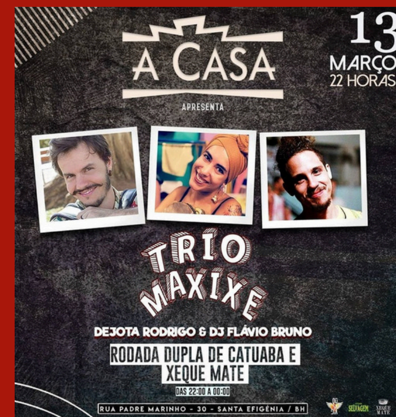
CANTORA NO TRIO MAXIXE 2016 A 2020