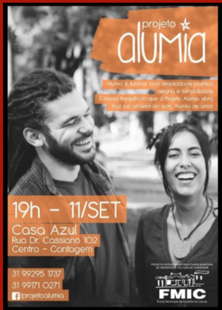
CANTORA NO PROJETO ALUMIA 2016