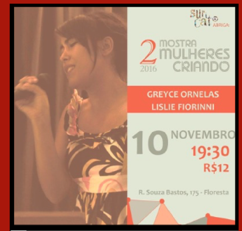
SHOW MULHERES CRIANDO SHOW AUTORAL - 2019