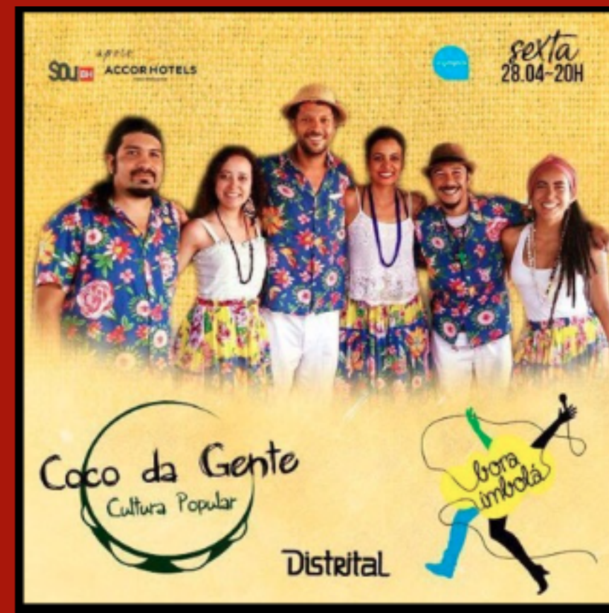
CANTORA NO COCO DA GENTE 2017 A 2019