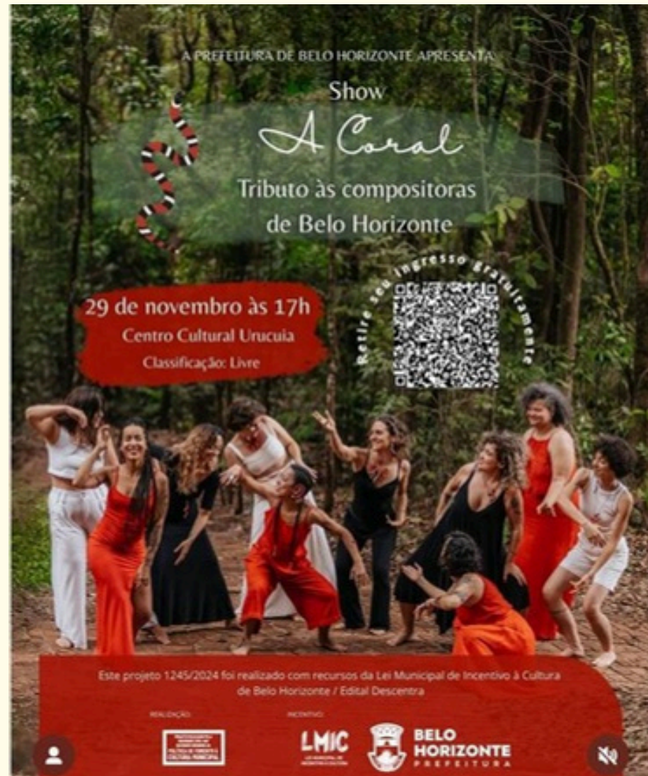
Show tributo as compositoras de Belo Horizonte - Coletivo A Coral - 2025 - edital Descentra.